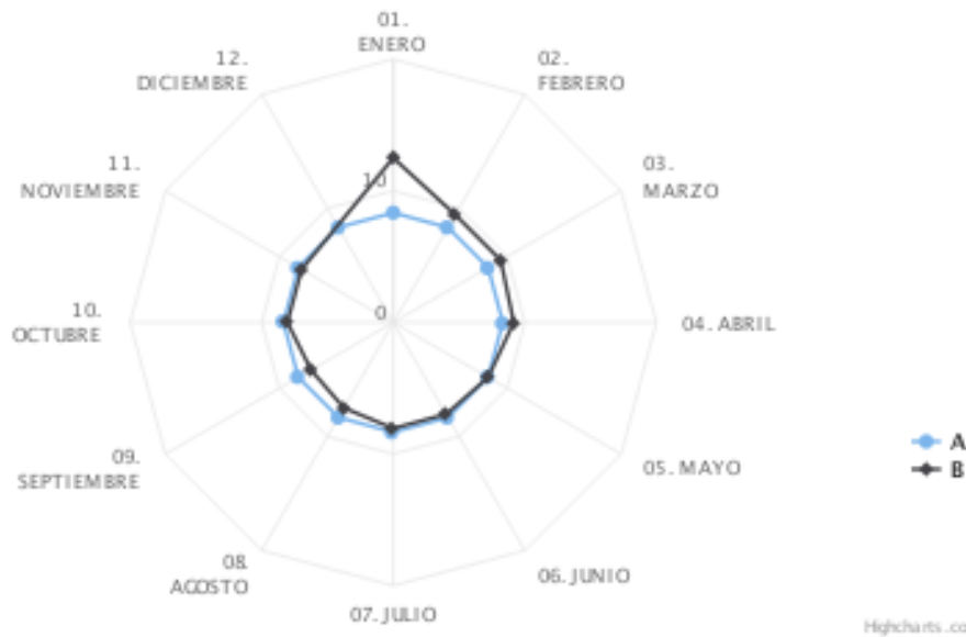
Publicación oportuna de los Estados Financieros de la Entidad